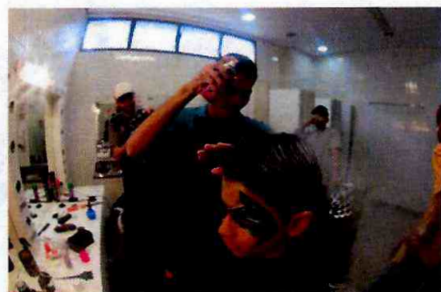
Especial Dia das Crianças