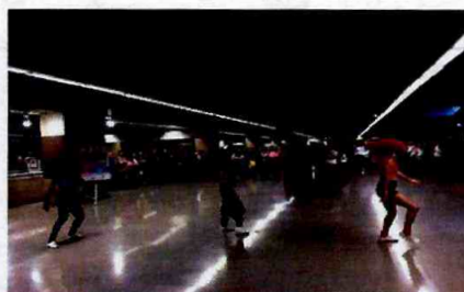
Valnita (cover Anita) - 3 Republica