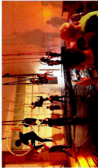
Formatura Cultural - Ateliê de Circo - CFC Itaim Paulista