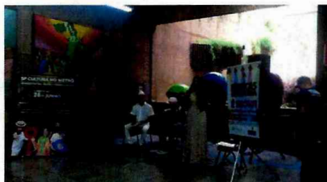
Matriarcas – Mal Deodoro