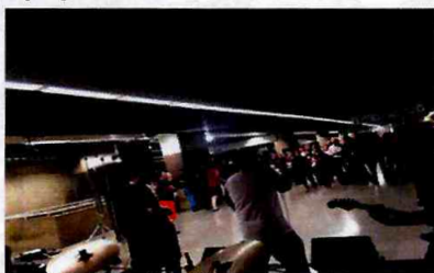
Banda Cidadão do Bem - República