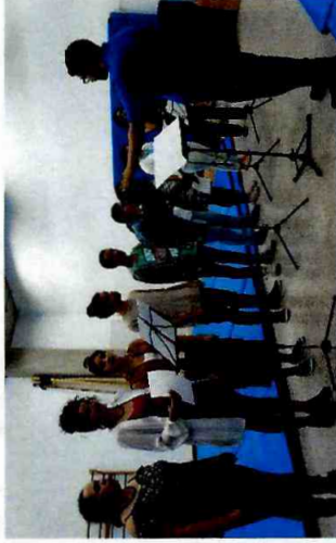
Trilha de Curta Duração em Bordados Peruanos - CFC Cid. Tiradentes; Trilha de Curta Duração em Violão - CFC Sapopemba; Trilha de Curta Duração "O Corpo da Voz" - CFC Itaim Paulista