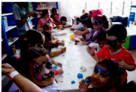
Especial Dia Das Crianças;