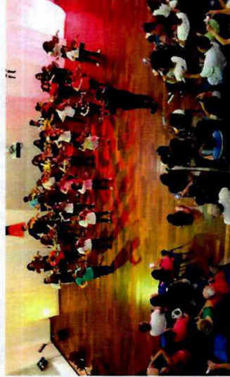
Formatura Cultural - Ateliê de Violino - CFC Vila Curuçá