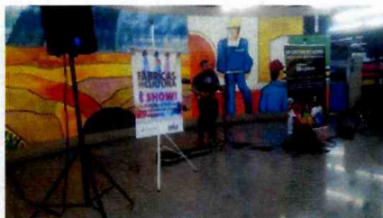
Digo Voz - Tatuapé