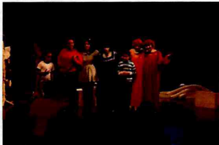
Espetáculo: "O Lugar de onde se vê"