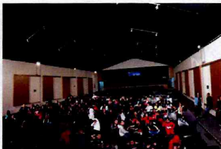
Espetáculo de Dança "Gumbot"

Participação no SP Cultura no Metrô - o projeto leva programação especial para diversas linhas do Metrô da capital paulista. Além de espetáculos de teatro, música e dança, também serão realizadas apresentações de músicos profissionais ou amadores.