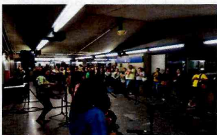
Trio Beijo de Moça - São Judas