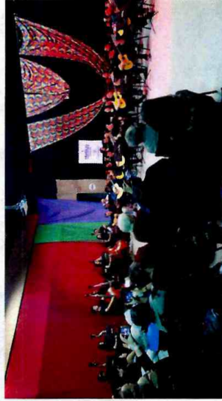
Formatura Cultural - Ateliê de Violão - CFC Sapopemba