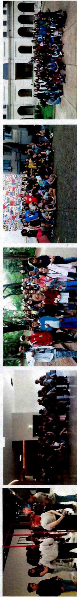
SESC Pompéia - CFC Vila Curuçá; Teatro Sérgio Cardoso - "O Lago dos Cisnes" - CFC Sapopemba; 33º Bienal de Artes - CFC Itaim Paulista; Teatro Jovem Marginalia - ENSAIOS - CFC Cid. Tiradentes e Museu da Imigração - CFC Parque Belém

Item 6.2: As Fábricas de Cultura Itaim Paulista e Parque Belém superaram a meta trimestral devido as saídas realizadas a mais. Em 2018, todas as Fábricas atingiram a meta adequadamente.