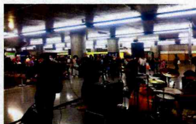
Banda Rarefeito - Sé