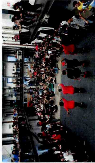
Formatura Cultural - Ateliê de Street Dance - CFC Parque Belém