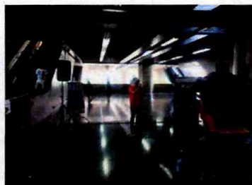
Paulo Neto - Brás