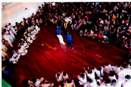
Batizado de Capoeira