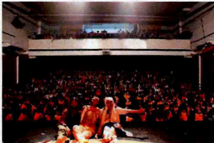
Espetáculo: "Lavadores de Histórias"