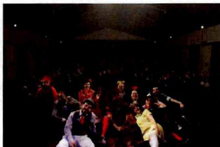
Espetáculo: "Numvaideu" da Cia Doutores da Alegria