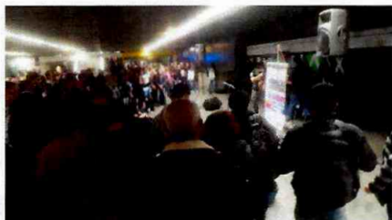
Banda: Seminovos e Ousado – República