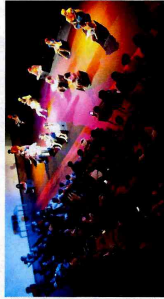
Formatura Cultural - Ateliê de Teatro - CFC Cidade Tiradentes