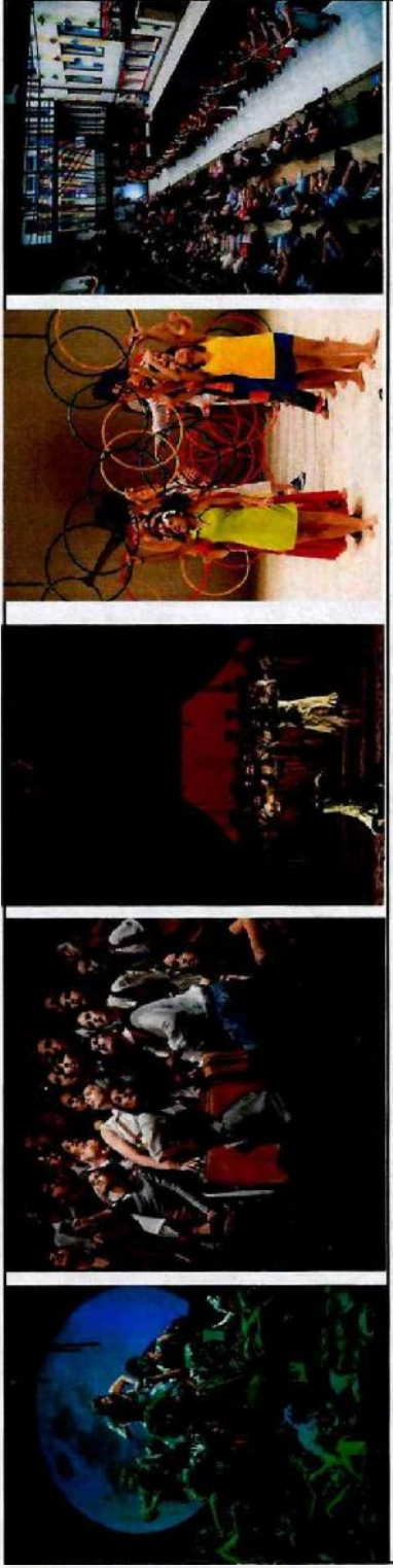
Cenas dos Espetáculos, respectivamente: CFC Vila Corupá, CFC Sapopemba, CFC Vila Paulista, CFC Cidade Tiradentes e CFC Parque Belém

Justificativas das ações com ICM abaixo de 100% ou acima de 120%: Item 34: A meta foi superada em todas as Fábricas devido às apresentações realizadas a mais nas próprias Fábricas, que utilizaram a infraestrutura disponibilizada, o que não impactou em custos adicionais. Para 2018 foi sugerida a ampliação desta meta. Item 35: A meta de público foi superada em todas as Fábricas devido à grande participação dos aprendizes e da comunidade. Para 2018 foi sugerida a ampliação desta meta.