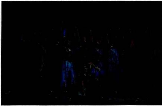
Tribocá – Guerreirxs da noite