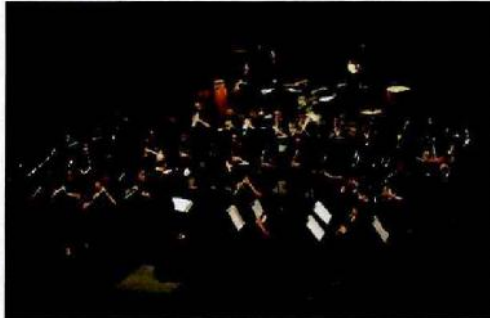
Apresentação da Banda Sinfônica