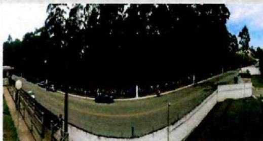
Fila de cerca de 1,5 km para atendimento na RC Cid. Tiradentes

A Ação Social realizada, em parceria com o CIEE, nas unidades Cidade Tiradentes, Itaim Paulista e Sapopemba, atendeu em 2017 9.650 jovens que puderam realizar cadastro para emprego, receberam orientação profissional e foram encaminhados para oportunidades de trabalho.