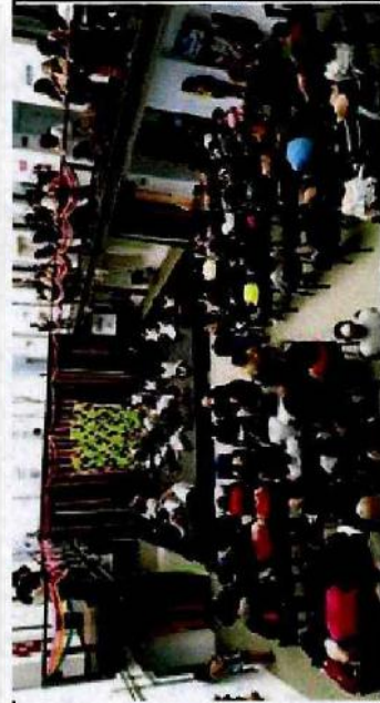
Ateliê de Teatro - CFC Vila Curuçá; Ateliê de Flauta - CFC Itaim Paulista; Ateliê de Street Dance - CFC Parque Belém