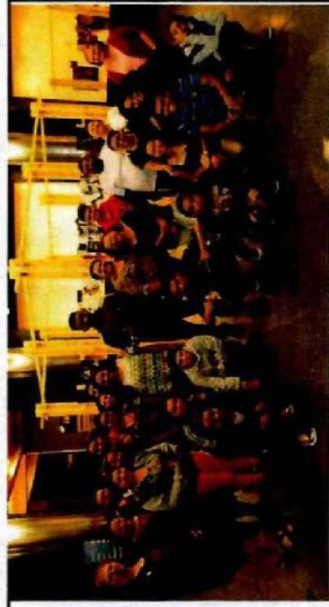
Teatro Sérgio Cardoso, VAMP, O Musical - CFC Vila Curuçá, Museu Afro - CFC Sapopemba, Caixa Cultural, Exposição Amazônia Negra - CFC Cidade Tiradentes